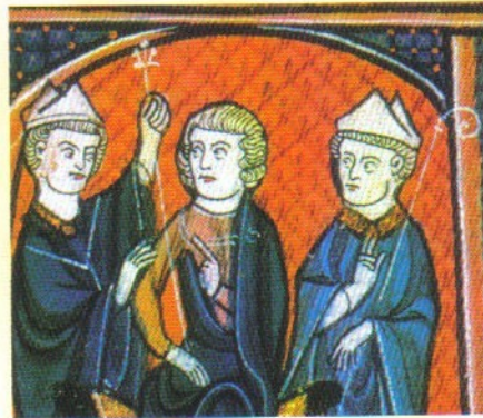
b. La remise du sceptre.