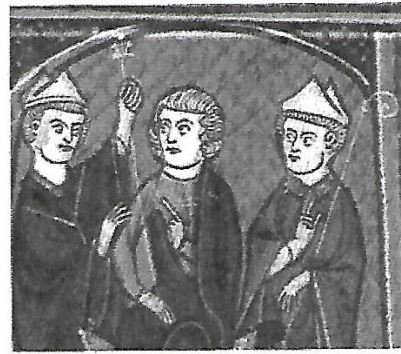
b. La remise du sceptre.