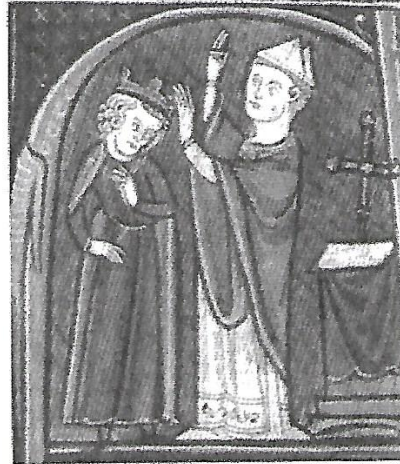
d. Le couronnement. Le roi reçoit de l'archevêque la couronne.

1 Cérémonie du sacre en la cathédrale de Reims. Miniatures, Ordre de la consécration et du couronnement des rois de France, vers 1280, BNF, Paris.