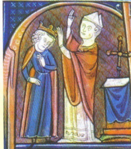
d. Le couronnement. Le roi reçoit de l'archevêque la couronne.