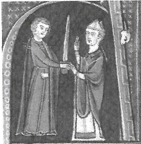
c. La remise de l'épée