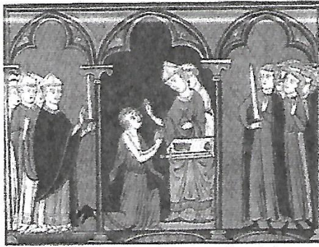
a. L'onction. L'archevêque oint le roi de l'huile sainte. Le connétable tient l'épée.